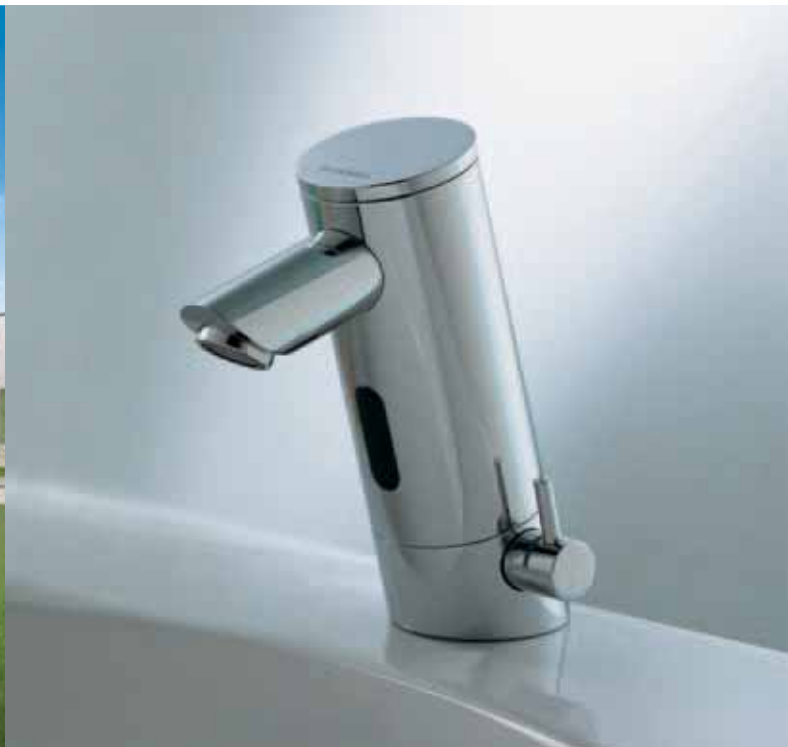
Grifería electrónica para lavabo PURIS E