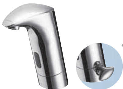
Grifería electrónica para lavabo VENUS E *Disponible en versión mezclador