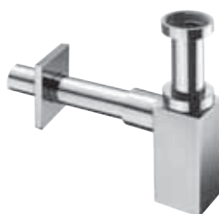
Sifón de diseño QUAD