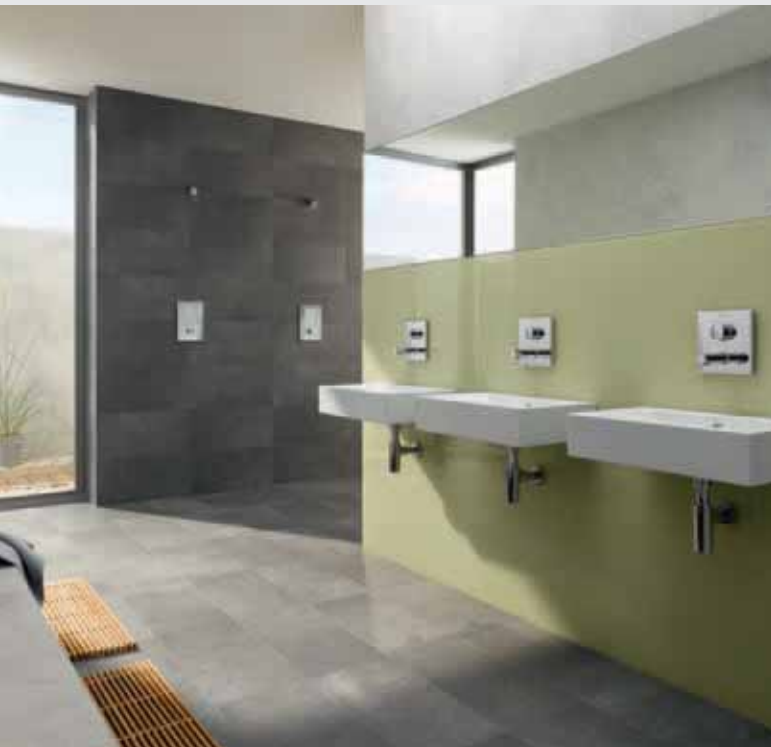
Grifería mural empotrada LINUS W-SC-M