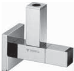
Llave de escuadra de diseño QUAD con elemento decorativo en vidrio

Pueden utilizarse en restaurantes y hoteles, polideportivos y aeropuertos, en el sector industrial, hospitales, residencias de ancianos, edificios de oficinas, etc.