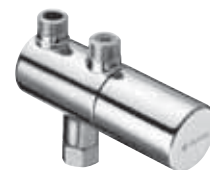
Válvula termostática para limitar la temperatura máxima