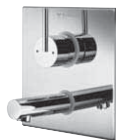
Grifería mural empotrada monomando LINUS W-EH-M