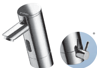
Grifería electrónica para lavabo PURIS E *Disponible en versión mezclador