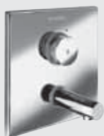
Grifería mural empotrada SCHELL LINUS W-SC-M, (Temporizada, mezcladora)