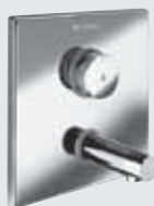
Grifería mural empotrada SCHELL LINUS W-SC-V, (Temporizada, para un agua)