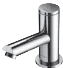
Grifería electrónica con cierre automático TIPUS P