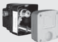
Caja de empotramiento Masterbox SCHELL WBW-SC-V, (Temporizada, para un agua)

Caja de empotramiento para montaje en combinación con el embellecedor, con cuerpo premontado en la caja de empotramiento fabricada en ABS negro • Cartucho temporizadas SC-V, un agua • Llaves de corte y de retención con filtro previo y material de fijación y tapa