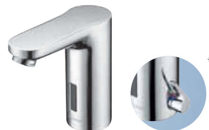
Grifería electrónica para lavabo CELIS E *Disponible en versión mezclador