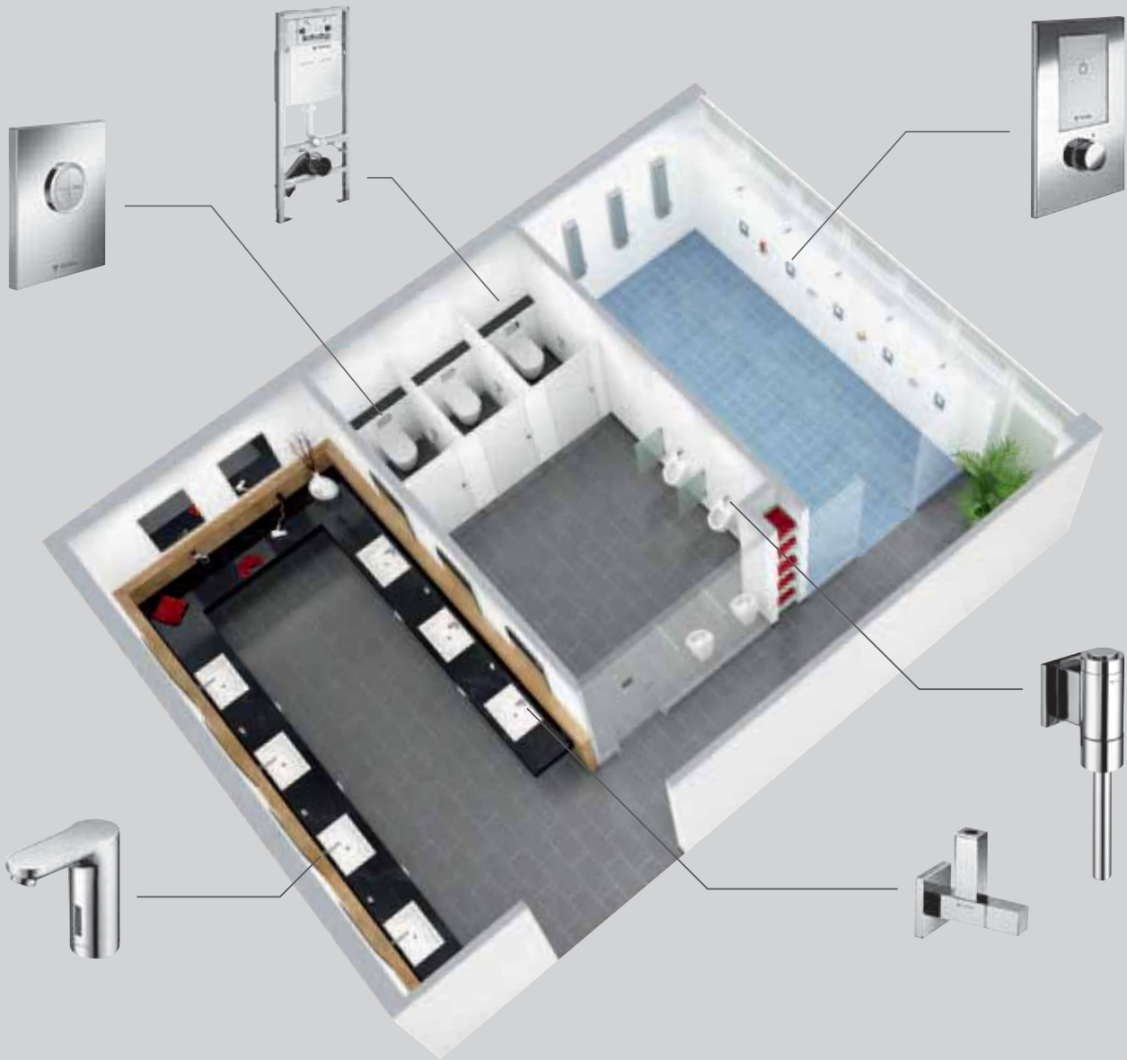
Griferías para lavabo