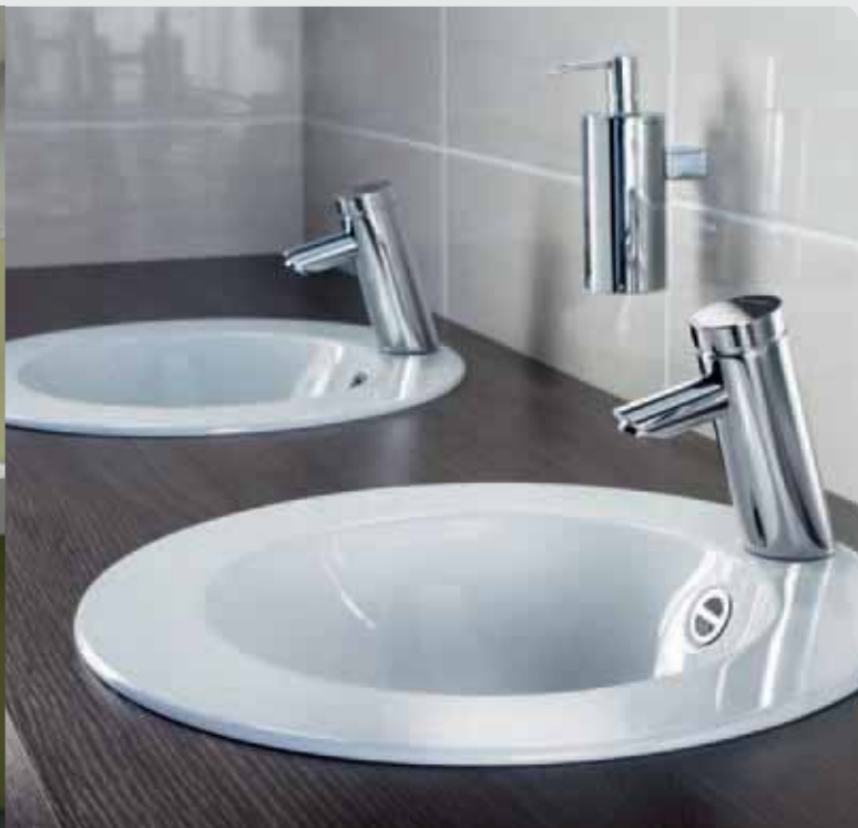
Grifería para lavabo temporizada PURIS SC