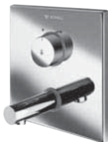
Grifería mural empotrada temporizada LINUS W-SC