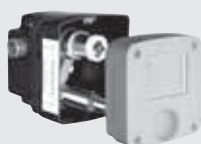
Caja de empotramiento Masterbox SCHELL WBW-SC-M, (Temporizada, mezcladora)

Caja de empotramiento para montaje en combinación con el embellecedor, con cuerpo premontado en la caja de empotramiento fabricada en ABS negro • Cartucho temporizado SC-M (mezclador) • Llaves de corte y de retención con filtros previos y material de fijación y tapa.