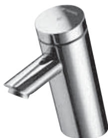
Grifería temporizada PURIS SC Versión mezcladora o para un agua