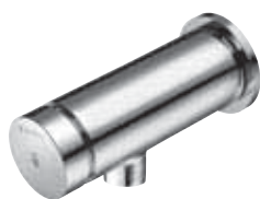
Grifería mural temporizada PETIT-SC