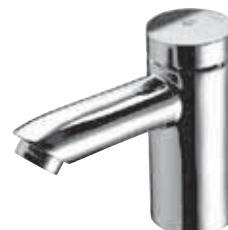
Grifo temporizado para un solo agua PETIT SC