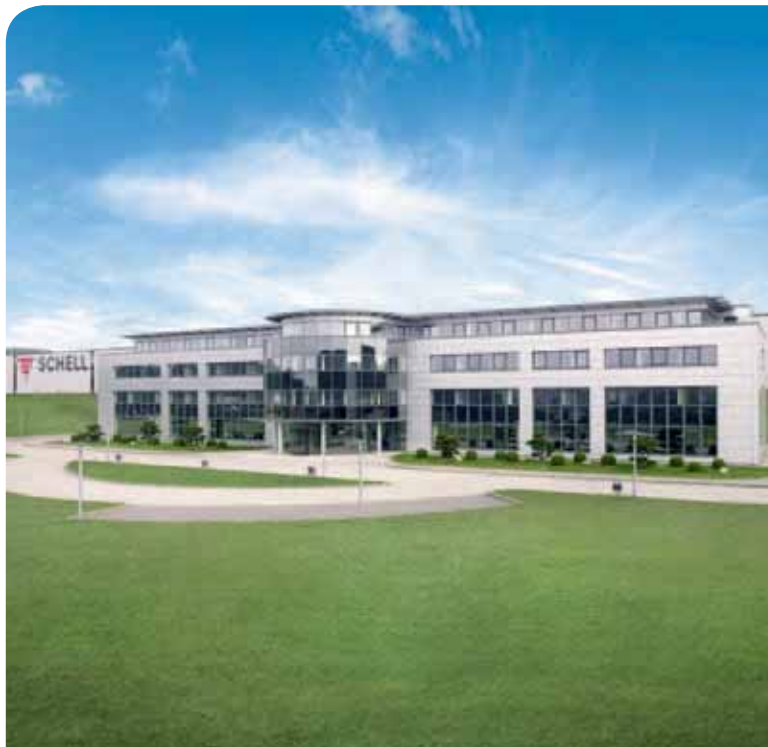
Planta 1 – Fábrica, administración y centro de RRHH