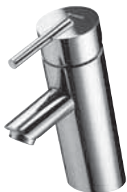
Mezclador monomando PURIS Line