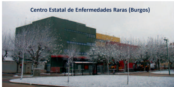
Centro Estatal de Enfermedades Raras (Burgos)