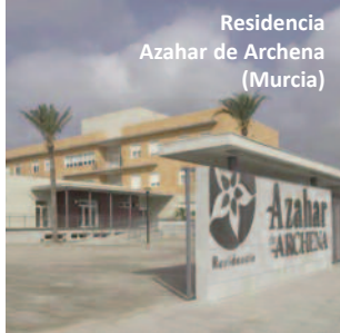
Residencia Azahar de Archena (Murcia)