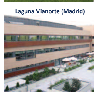
Laguna Vianorte (Madrid)