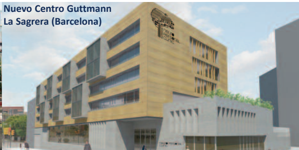
Nuevo Centro Guttman La Sagra (Barcelona)