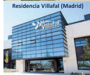
Residencia Villafal (Madrid)