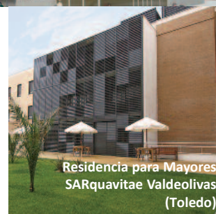
Residencia para Mayores SARquavita Valdeolivas (Toledo)

Centro Sociosanitario Ecoplar Mirasierra (Madrid)