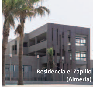
Residencia el Zapillo (Almería)