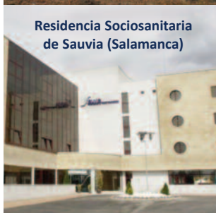
Residencia Sociosanitaria de Sauvia (Salamanca)