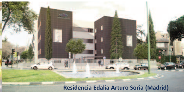
Residencia Edalia Arturo Soria (Madrid)