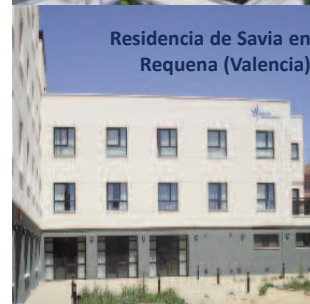
Residencia de Savia en Requena (Valencia)