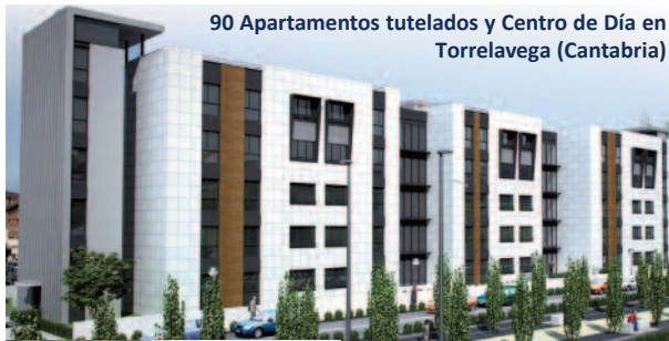
90 Apartamentos tutelados y Centro de Día en Torrelavega (Cantabria)