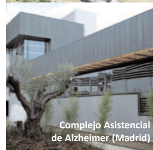
Complejo Asistencial de Alzheimer (Madrid)