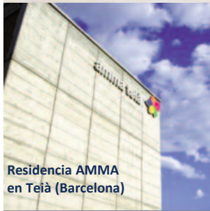
Residencia AMMA en Teià (Barcelona)