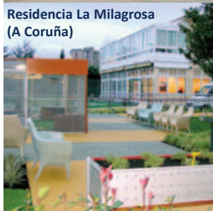
Residencia La Milagrosa (A Coruña)