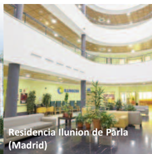
Residencia Ilunion de Pàrta (Madrid)